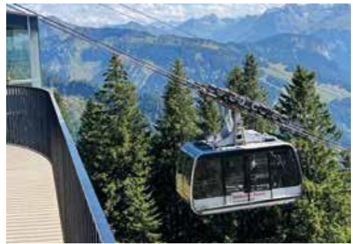
Seilbahn Bezau bergrenzerwald Bergbahnen Andelsbuch bergrenzerwald

Natürlich möchten wir auch Nichtwanderer zu unserem beliebten Treffen einladen. Für kulinarische Genüsse, Musik und Unterhaltung ist gesorgt. Der Landeswandertag findet bei jeder Witterung statt. Gutes Schuhwerk unbedingt erforderlich: Wir wandern auf eigene Gefahr!