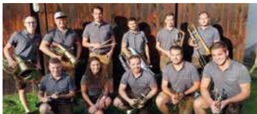
MuVukanten (Böhmische Besetzung)