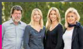
Ihre Familie Greber mit NKG-Team