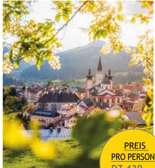
Mariazell Basilika Frühling Stehralm-4053

> Heute treten wir nach dem Frühstück die Heimreise an. Unterwegs machen wir einen Zwischenstopp am Königssee. Wir machen eine kleine Schifffahrt. Nach einer kräftigen Stärkung geht es zurück ins Ländle.