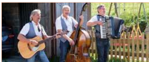
Tanzmusik mit „DRÜ“